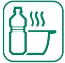
HUILES DE FRITURES