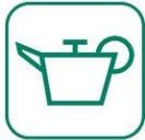
HUILES DE VIDANGE